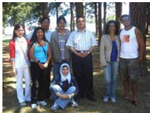
Arkansas (Julio 2009): Estudiantes de diversos países (Vietnam, Egipto, Brasil y Palestina)

trámite fue más complejo en cuanto a tiempos pero finalmente logré viajar a Arkansas. Para mí este viaje era muy significativo ya que me permitiría mejorar mi inglés y además era la primera vez que tenía la oportunidad de poner en práctica lo poco que sabía del idioma. En efecto, el vago conocimiento del mismo se fue complementando y enriqueciendo a lo largo de 2 meses (junio-agosto) del curso y de estancia en la universidad. Complementario a esto, la experiencia de convivir con estudiantes de diversos países (Vietnam, Tailandia, Egipto, Brasil y Palestina), y el intercambio con diferentes idiomas y culturas, fueron muy valiosos y gratificantes.