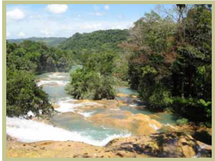
Agua Azul, Municipio de Chilón, México.

Llora al compás del trinar de jojkotetik 2 Jojkotawiscola 3 Jojkotawiscola quien anuncia proclamando el signo del destierro del mundo en decadencia.