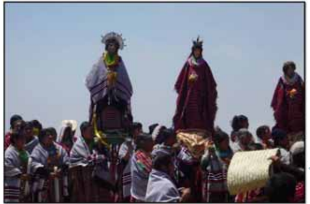
"Semana Santa Triqui"