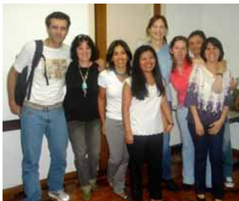
Algunos amigos y amigas integrantes del grupo de doctorado que me acompañaron en la defensa de mi tesis (16 marzo 2009)

Después de 4 años en Brasil y de defender la tesis doctoral, el 16 de marzo del presente año, retorno a mi México lindo y querido, con muchas expectativas y deseos de construir sueños y proyectos.