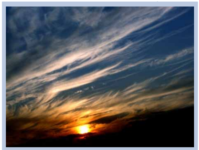
"Puesta del Sol"