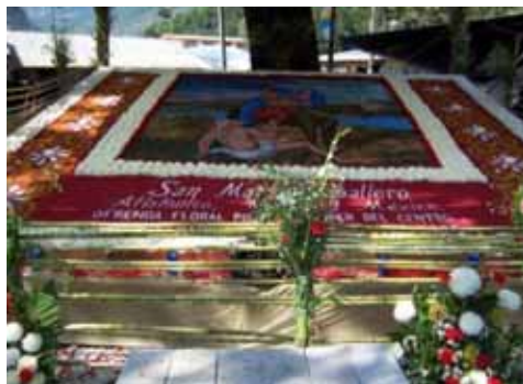
Arreglo floral de Santo Patrón, San Martín Caballero, Municipio de Atlahuilco, Ver., 4 de noviembre del 2008.

“Un día, San Isidro iba caminando con su yunta por el municipio de Atlahuilco, en su caminar se le ocurre pedir un poco de agua para sus reses a una mujer que estaba sentada muy cerca de su patio, la mujer se negó a proporcionar el vital líquido; molesto, San Isidro se aleja un poco de ahí y con la garrucha o el bastón que llevaba en la mano levanta una lápida de piedra, en ese momento brota una gran cantidad de agua y da de beber a sus reses. La mujer queda muy sorprendida al ver aquello, y en ese momento, San Isidro vuelve a colocar la lápida y continúa su camino rumbo al municipio de Xoxocotla. Cuando la mujer vuelve al lugar e intenta levantar la lápida para ver si hay agua, encuentra el sitio completamente seco. Y ese fue la maldición para que toda la cabecera municipal de Atlahuilco no tenga un solo manantial hasta el día de hoy”