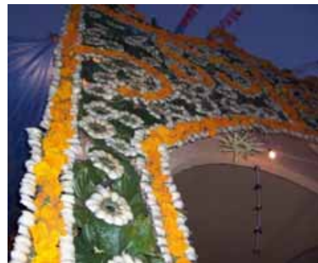
Detalles del retablo floral "Xochitlacolotl", Municipio de Atlahuilco, Ver., 4 nov. 2008.

Eleuterio Citlahua Apale es originario de Veracruz y pertenece a la tercera generación de becarios IFP.