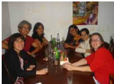
Amigos y amigas en una de las últimas cenas de despedida (23 abril 2009)

lazos de amistad que tuve la fortuna de construir a lo largo de mi estancia en el Cono Sur. En fin, entre la nostalgia y la emoción me di a la tarea de preparar el equipaje y cerrar todos los pendientes en mi recinto de la República.