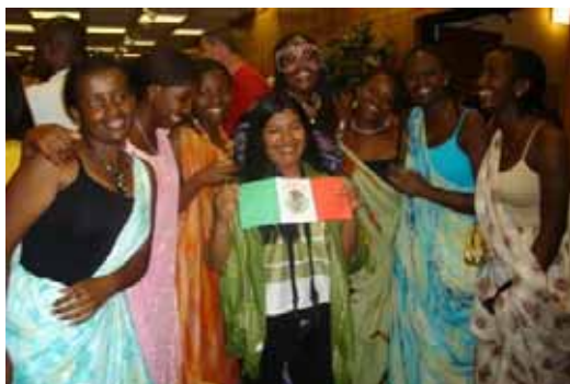
Convivencia con estudiantes de África en el evento multicultural en la Univ. de Arkansas durante el curso de inglés (Junio 2009)

Paralelamente a la situación anterior, inicié los trámites de la visa para poder viajar a la ciudad de Arkansas en los Estados Unidos, en donde llevaría a cabo el curso de verano de inglés apoyado por el IFP, a través del International Language Center de la Universidad de Arkansas. Desafortunadamente, por los acontecimientos vividos en esos días en el país, la realización del