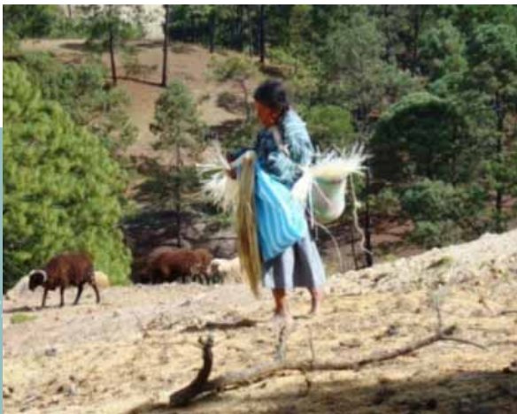
"Mujer indígena de Ignacio Zaragoza"