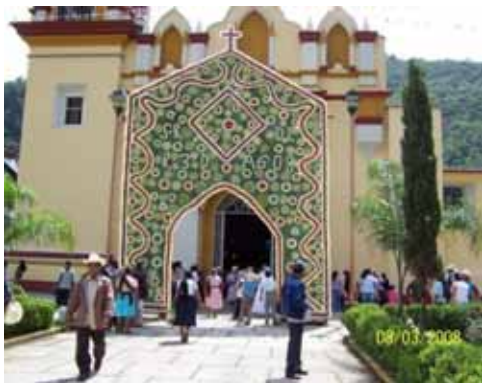
Foto: Eleuterio Citlahua Apale. Retablo floral "Xochitlacolotl", Municipio de Zongolica, Ver., 3 agosto 2008.

Estas y muchas otras leyendas son las que tiene esta región enclavada en la parte más alta del estado de Veracruz. Otras leyendas son la maldad de las brujas, el ritual de las bodas, las cuevas encantadas, montañas famosas, personajes luminosos y el ataque de los coyotes.