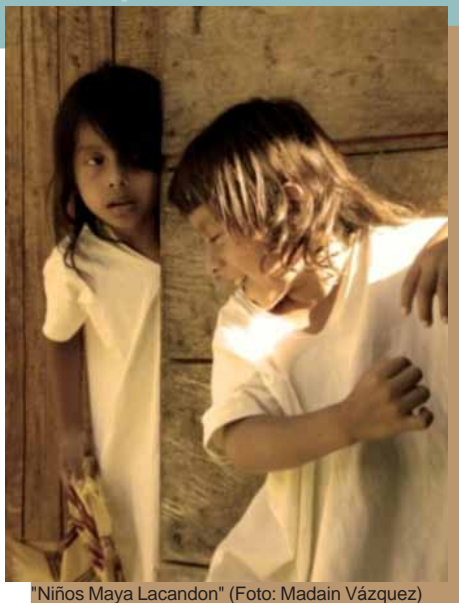
"Niños Maya Lacandon"