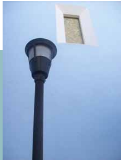
"Esperándote" (Foto: Saúl Miranda)